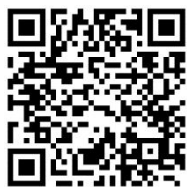
「空大 FB 臉書」