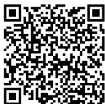
國立空中大學推廣教育中心 官網