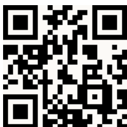
國立空中大學推廣教育中心 臉書粉絲專頁