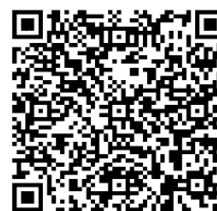
國立空中大學社會工作與社會福利實習 說明會 影片