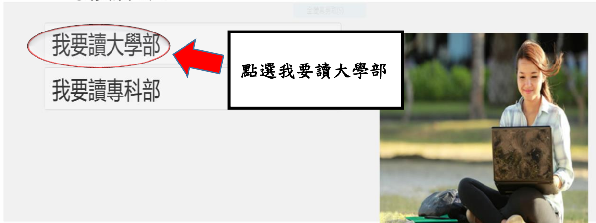
圖 1-2: 我要讀空大