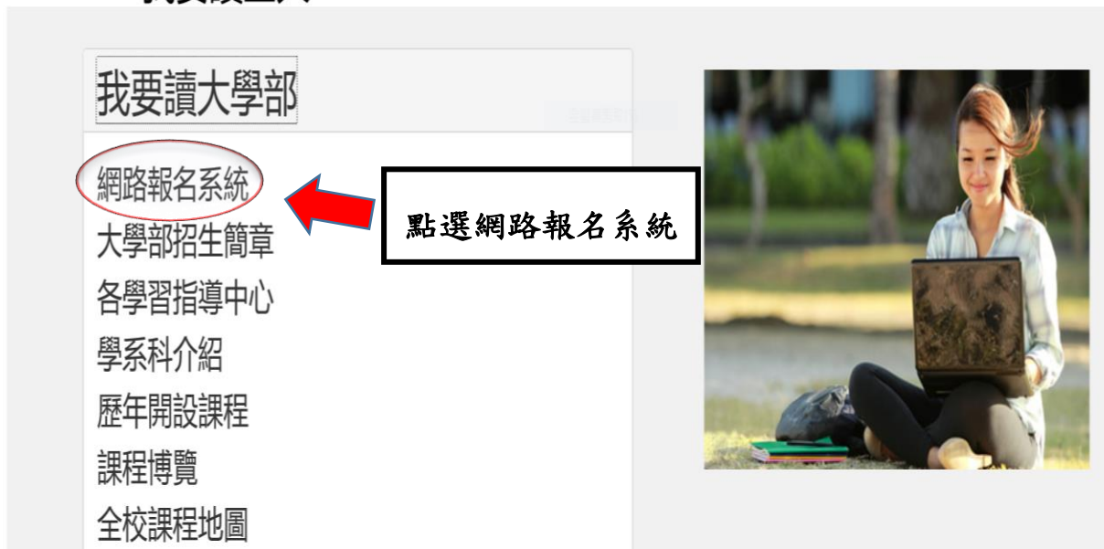
圖 1-3: 我要讀空大