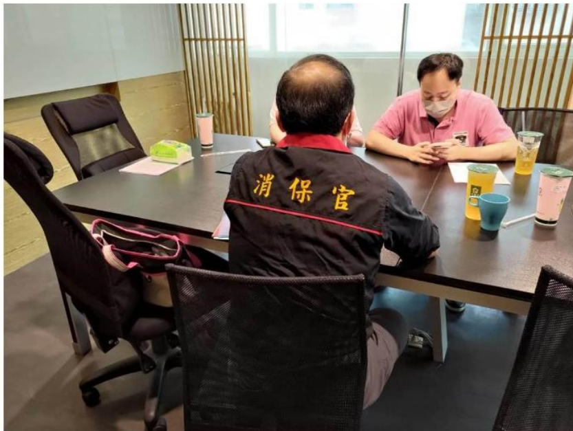
新北市法制局消保官查核7家費體及網路交友業者訂的定型化契約，結果大致符合規定。