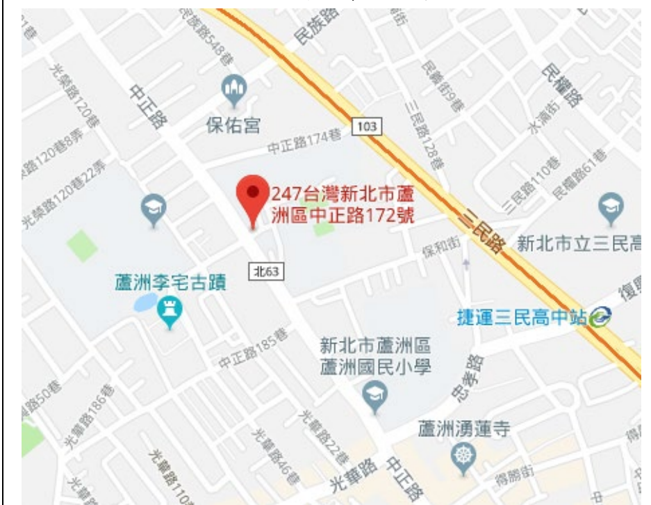
國立空中大學蘆洲校本部平面圖