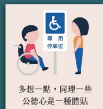
不占用身心障礙者 專用停車位