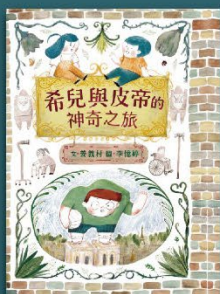
希兒與皮帝的神奇之旅 臺灣手語繪本