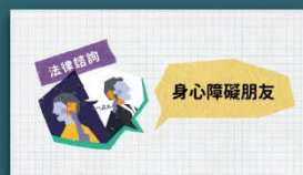
身心障礙者法律扶助專案