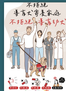
不拒絕導盲犬寄養家庭 不拒絕導盲幼犬