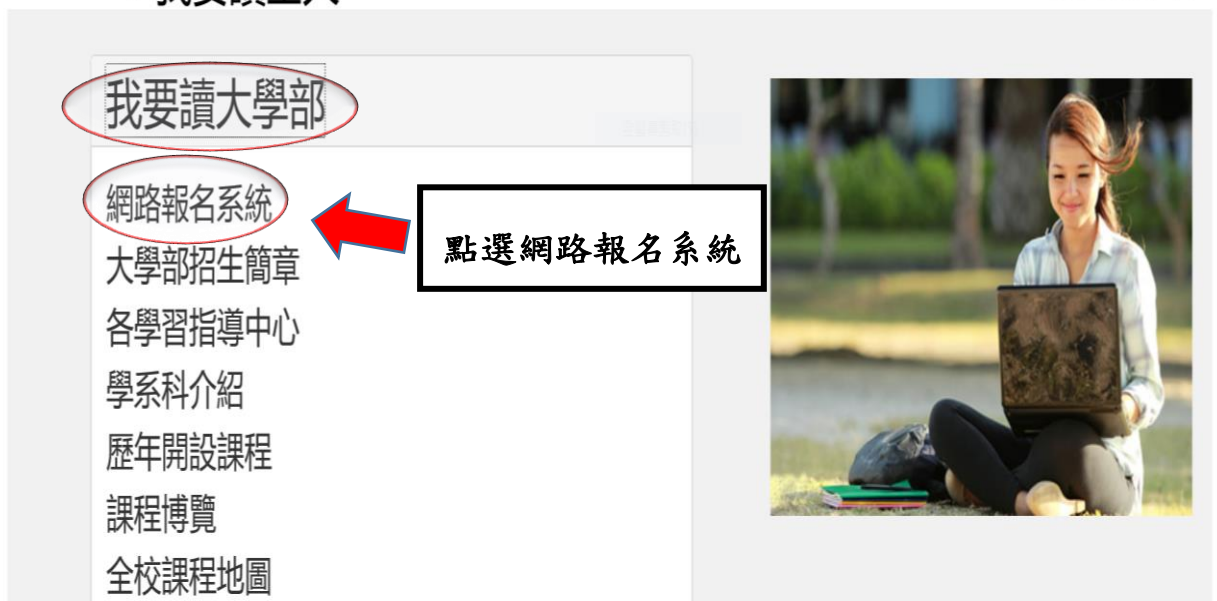
圖 1-3: 我要讀空大