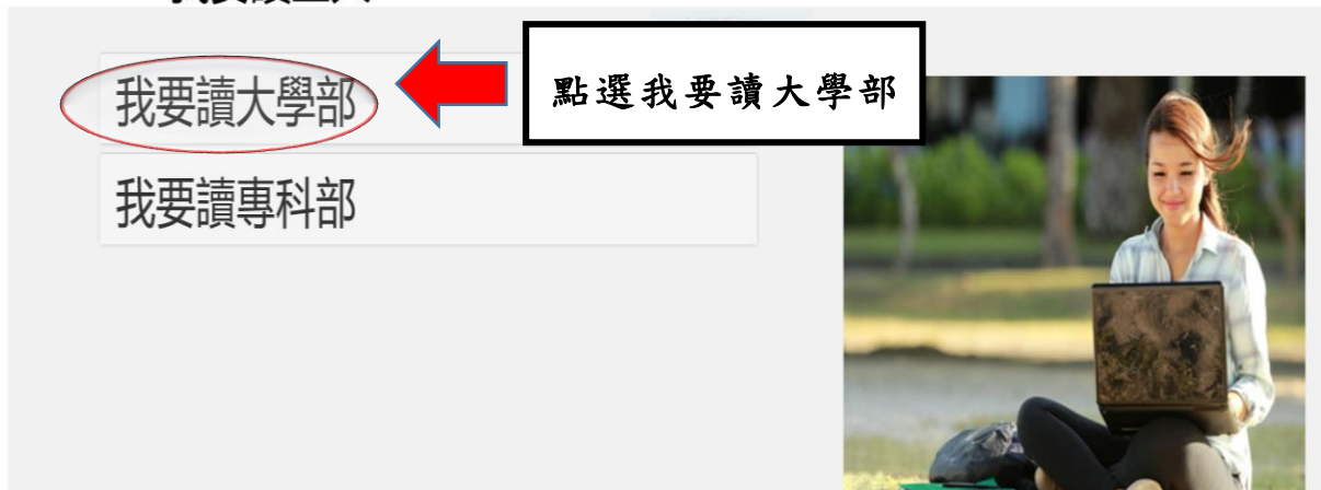
圖 1-2: 我要讀空大